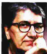
Píše: ĐURĐA KNEŽEVIĆ

Može li nova pravobraniteljica za ravnopravnost spolova, ambiciozna satnica HV-a, strojevim korakom pokrenuti stvari sa mrtve točke?