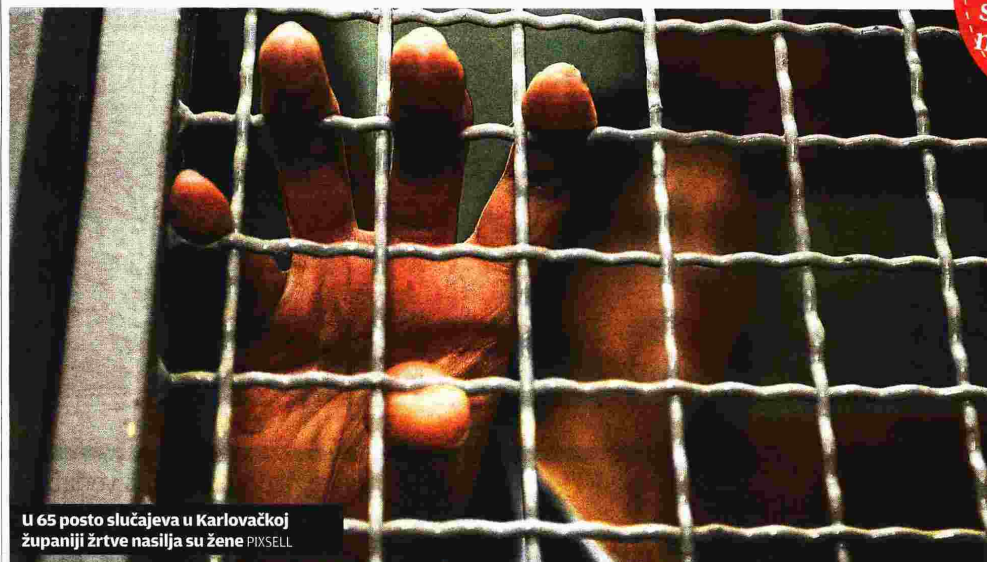
U 65 posto slučajeva u Karlovačkoj županiji žrtve nasilja su žene

Mnogi se slažu da žrtve ne bi trebale ići iz stana ili kuće, nego nasilnik